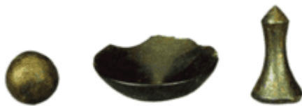
新乐遗址煤精制品

②沈阳故宫始建于1625年，占地面积六万多平方米，2004年被列入世界文化遗产名录。建筑风格融合满、蒙、藏、汉等多民族特色。建筑本身就是一座著名的古代宫廷艺术博物馆，馆藏文物十万余件。每一件文物、每一幅照片、每一段文字、每一个复原场景都是对沈阳这座城市发展的历史的解读。